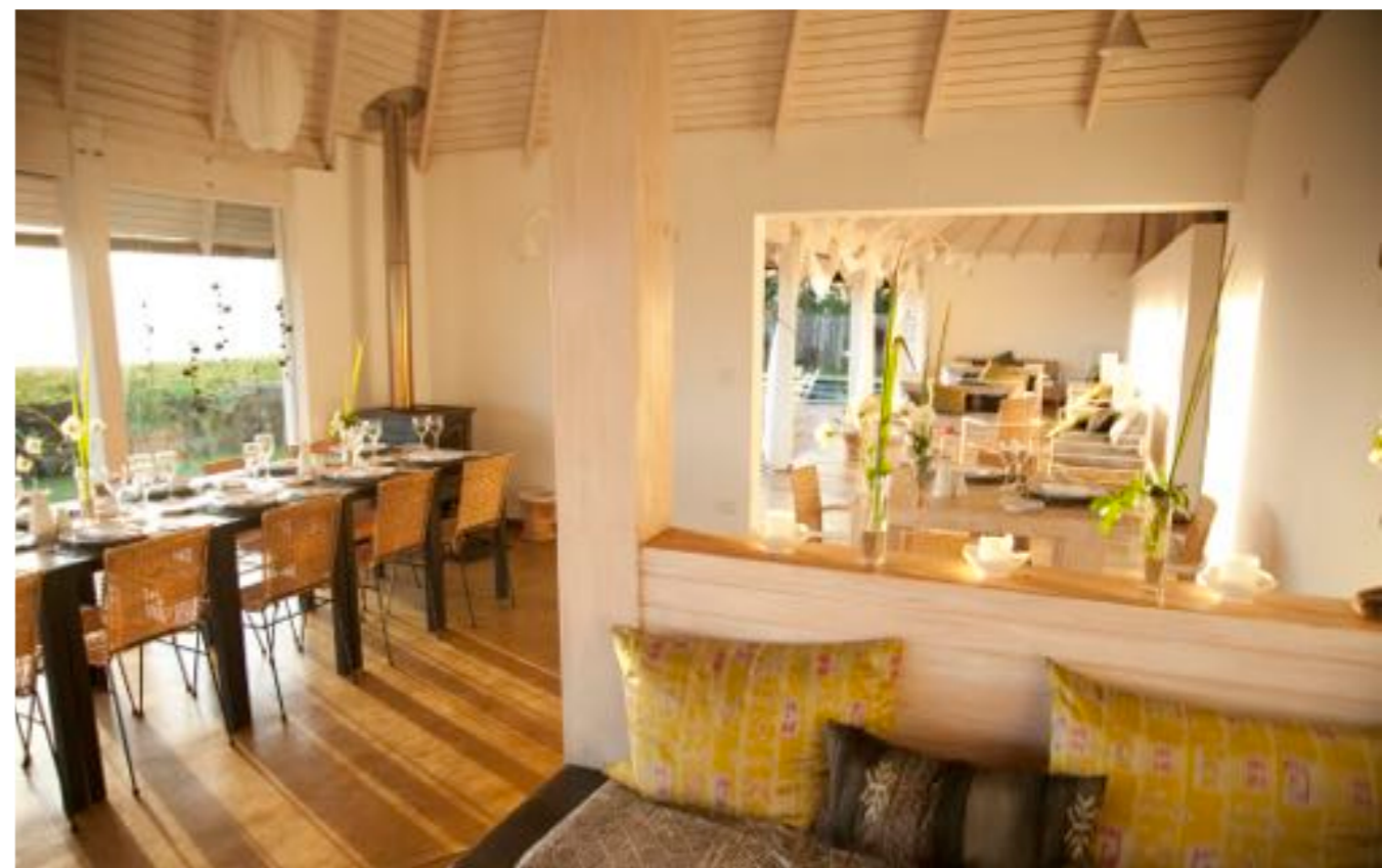
Amplios espacios comunes para el comedor y el bar, invitan a sentarse mirando el mar