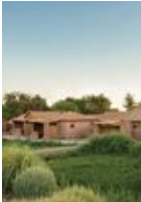
SAN PEDRO DE ATACAMA