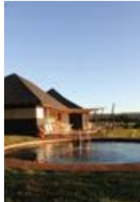
ISLA DE PASCUA