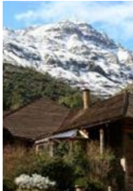
CAJÓN DEL MAIPO