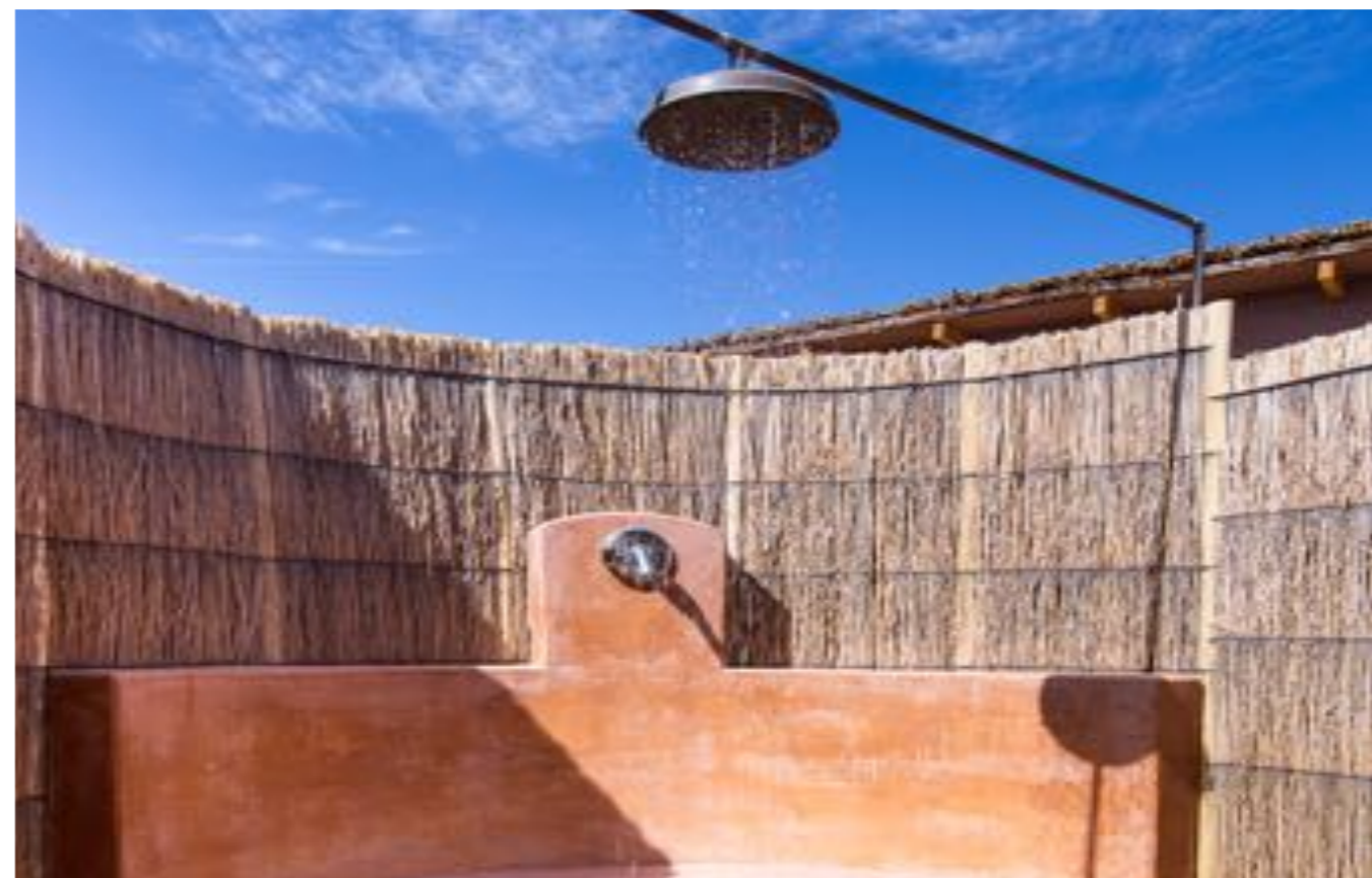
En algunas habitaciones hay duchas exteriores, o chimeneas en sus terrazas, con sus sombras de coligues y brea.